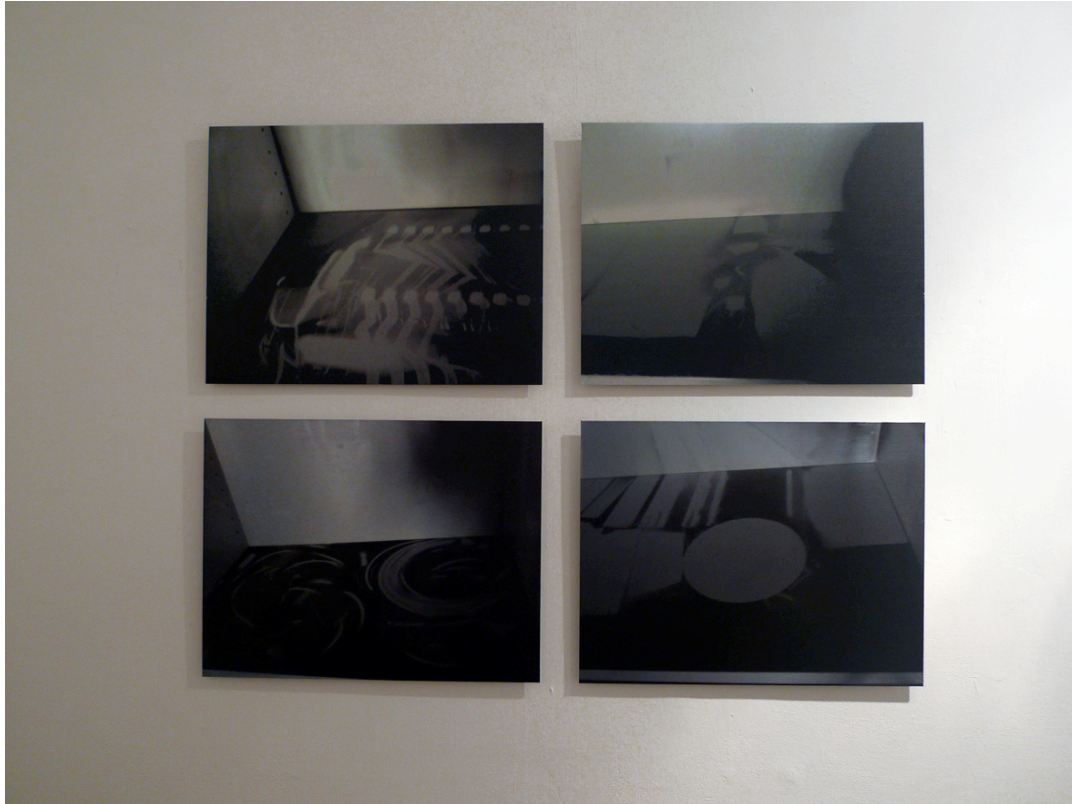
Soot Drawings, 2010

4 Digitaldrucke auf Aluminium, je 40 x 50 cm