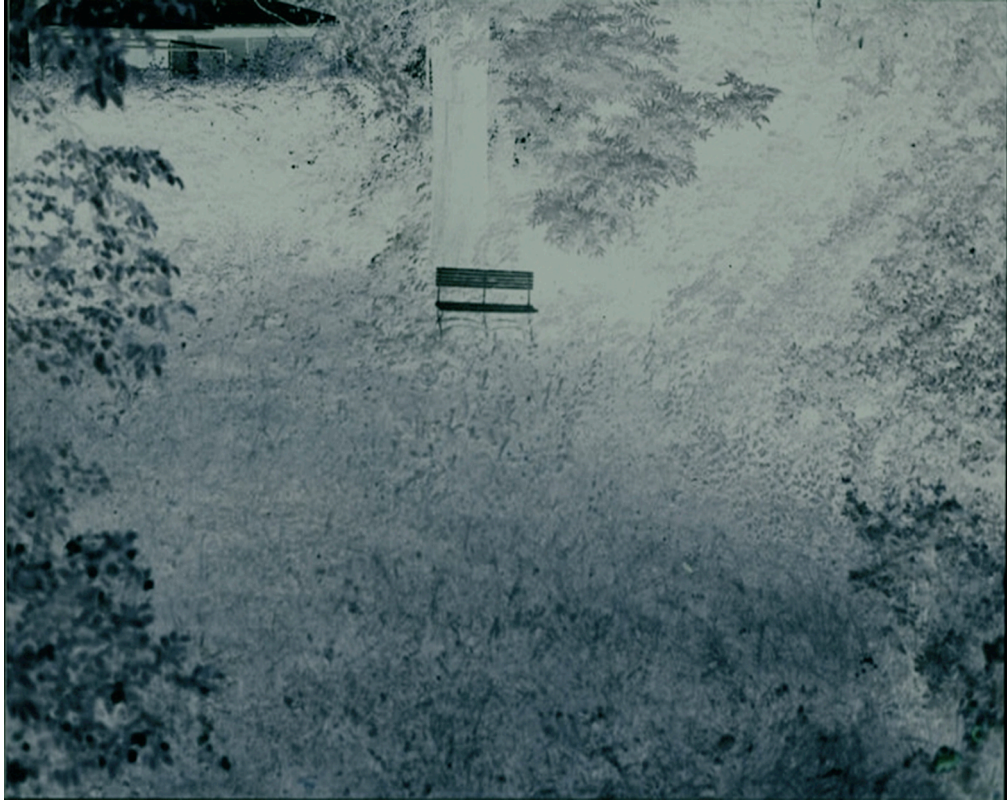
Klara Fragments #1, 2010 Serie von 7 Fotoarbeiten